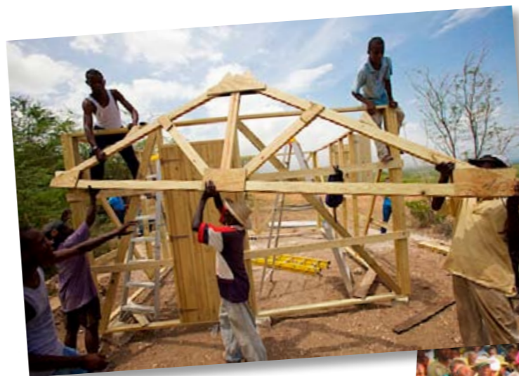
Cordaid Mensen in Nood bouwt huizen en biedt tienduizenden mensen onderdak

een nieuw onderkomen hebben gekregen. Bewoners zijn actief betrokken bij het bepalen van het ontwerp voor de huizen. Die betrokkenheid blijkt essentieel te zijn om te zorgen dat de huizen aansluiten bij de wensen en gebruiken van de Haïtiaanse bevolking.