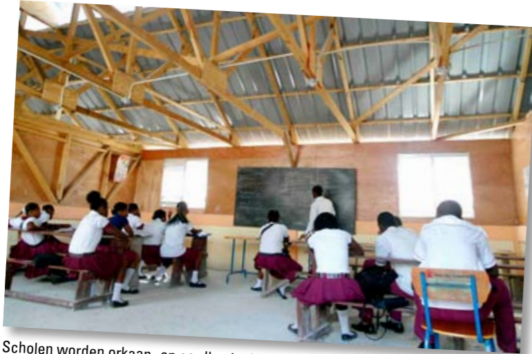
Scholen worden orkaan- en aardbevingbestendig herbouwd