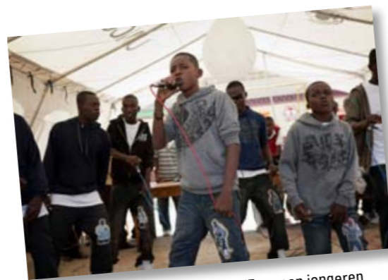
In een opvangcentrum van UNICEF roepen jongeren hun leeftijdsgenoten via rapmuziek op te helpen bij de wederopbouw van hun land

SHO-deelnemers werken waar mogelijk aan blijvende verbeteringen. Zo zijn de Haïtianen nu beter voorbereid op nieuwe rampen. Veel mensen hebben een noodrantsoen in huis en bewaren belangrijke (medische) documenten in plastic zakken. Het Rode Kruis leert mensen hoe zij rampen eerder kunnen herkennen en een dorp of gemeenschap snel kunnen evacueren. Cordaid Mensen in Nood bouwt niet alleen huizen, maar werkt ook aan betere infrastructuur in de wijken. Hulporganisaties als Unicef and Save the Children (her-)bouwen scholen orkaan- en aardbevingbestendig, trainen docenten en stellen nieuwe lesprogramma's samen. Op veel plekken worden permanente watervoorzieningen aangelegd, bijvoorbeeld door Oxfam Novib.