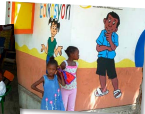
Peuters voor het eerst naar school