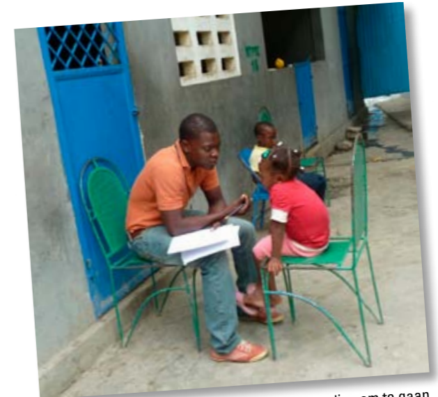
Kinderen leren via traumaverwerking met verlies om te gaan

SHO-deelnemers besteden ook aandacht aan de geestelijke gezondheidszorg. Het Leger des Heils steunt een project waar kinderen en jongeren leren omgaan met verlies. Dat kan het verlies zijn van hun huis, maar ook van familieleden of leeftijdsgenootjes. Ouders en verzorgers worden actief bij het project betrokken. Getrainde veldwerkers helpen de kinderen bij het verwerken van hun trauma en leren kinderen weer te spelen en contact te leggen met andere kinderen.