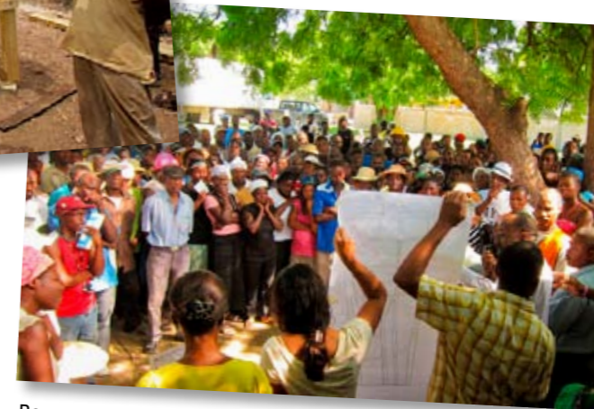
Bewoners denken mee over het ontwerp voor nieuwe huizen