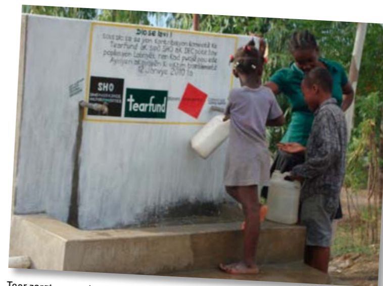
Tear zorgt voor schoon drinkwater door het slaan van waterputten en de aanleg van goede sanitaire voorzieningen

Bekijk hier hoe jongeren die een arm of been verloren bij de aardbeving, de draad van hun leven weer oppakken Bekijk het filmpje.