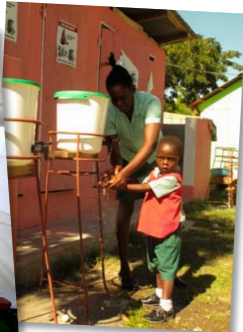
Goede hygiëne voorkomt ziektes